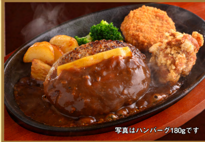
写真はハンバーグ180gです

ハンバーグ 120g 1240円 (税込1364円) ハンバーグ 180g 1470円 (税込1617円)