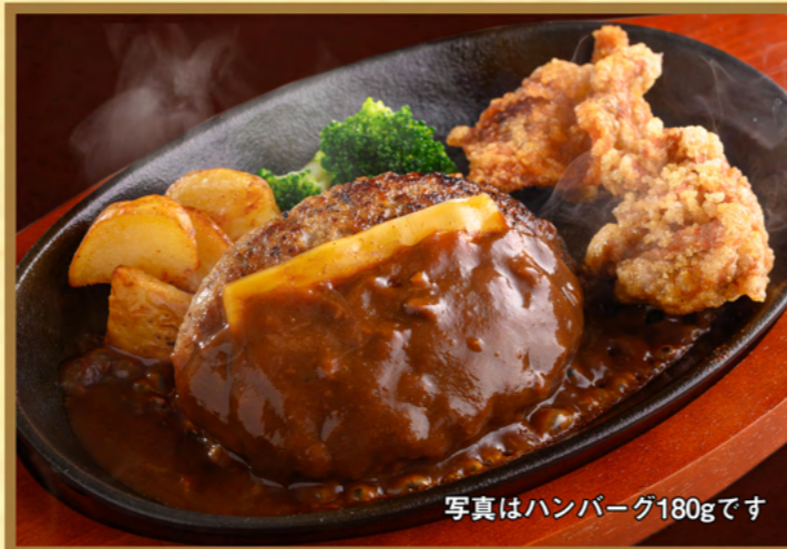
写真はハンバーグ180gです