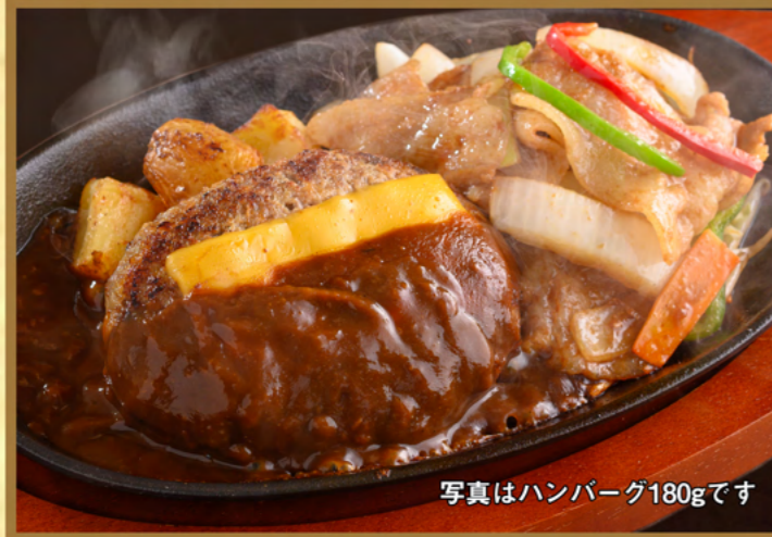
写真はハンバーグ180gです